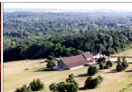
La Ferme de Montblin